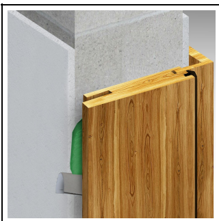
1. Bild: 3D-Ansicht FM790